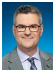
Éric Caire Député de La Peltrie Ministre délégué à la Transformation numérique gouvernementale